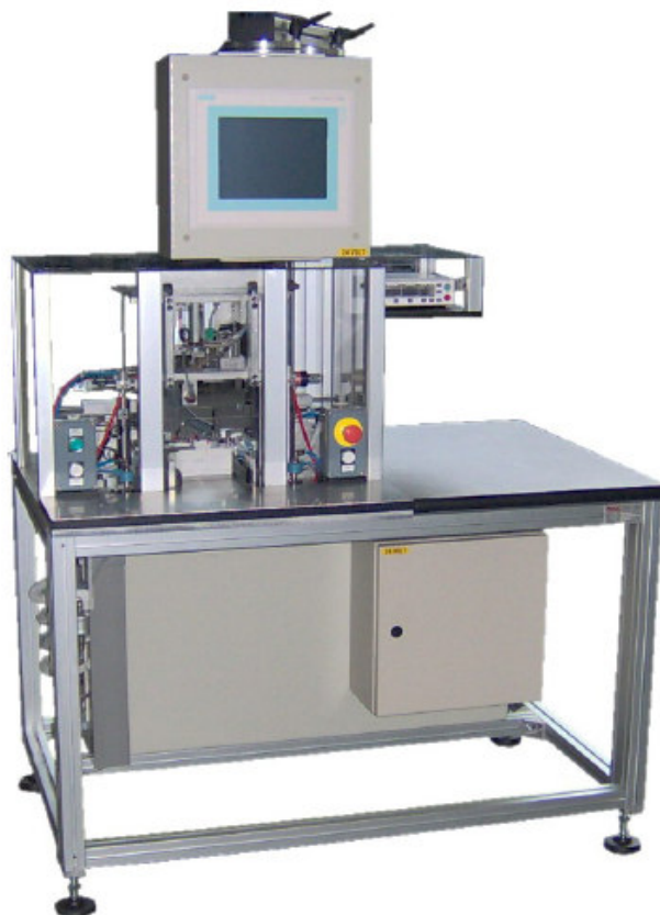
Esempio tipico di un'apparecchiatura dedicata al collaudo in automatico di interruttori magnetotermici.

MCB è in grado di fornire sistemi automatizzati completi anche in caso di test per interruttori con un ciclo di manovre meccaniche (per esempio apertura e chiusura e sgancio dell'interruttore, ecc).